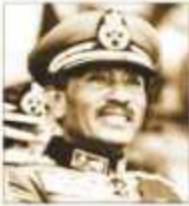
محمد أنور السادات