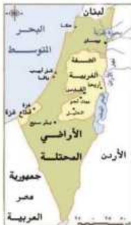
خريطة (٢٣) فلسطين بعد حرب ١٩٤٨م