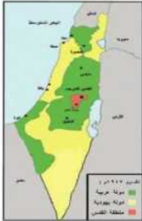
خريطة (٢٢) تقسيم فلسطين عام ١٩٤٧م