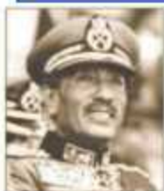
محمد أنور السادات

- بدأت سوريا ومصر الهجوم فى لحظة واحدة طبقا للاتفاق العسكرى بينهما .