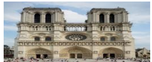
La Notre Dame