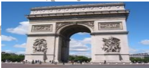
L'Arc de Triomphe